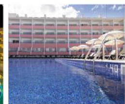
Luna Hotel daoura