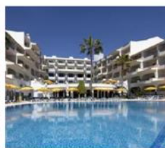
Luna Miramar Club