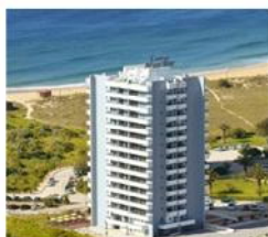
Luna Alvor Bay